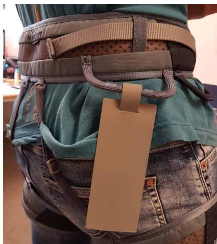
Voorbeeld label aan gordel